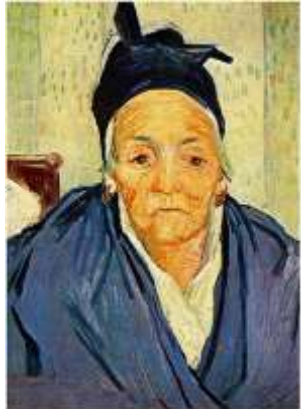
Una donna anziana di Arles 1888 Vincent Van Gogh