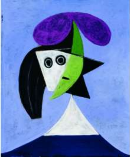
Pablo Picasso- Donna con cappello

43 anni dolore addominale in fossa iliaca sinistra da due giorni Esame ematici: pcr 1,83, globuli bianchi normali Esame obiettivo: segno di difesa addominale in fossa iliaca sinistra Viene inviata alla diagnostica per immagini per ecografia addome.